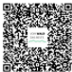
QR-Code für die online Buchung

Die Hundefahrkarte für die tschechische Bahn (ca. 1,70 €) ist am Grenzbahnhof vor der Fahrt bei der Reiseleitung zu besorgen. Hunde benötigen einen Maulkorb!